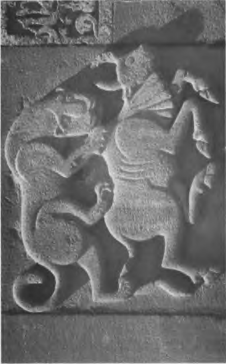
Diyarbakır Ulu Camii'nin ana girişindeki friz (12. yüzyılın birinci yarısı).