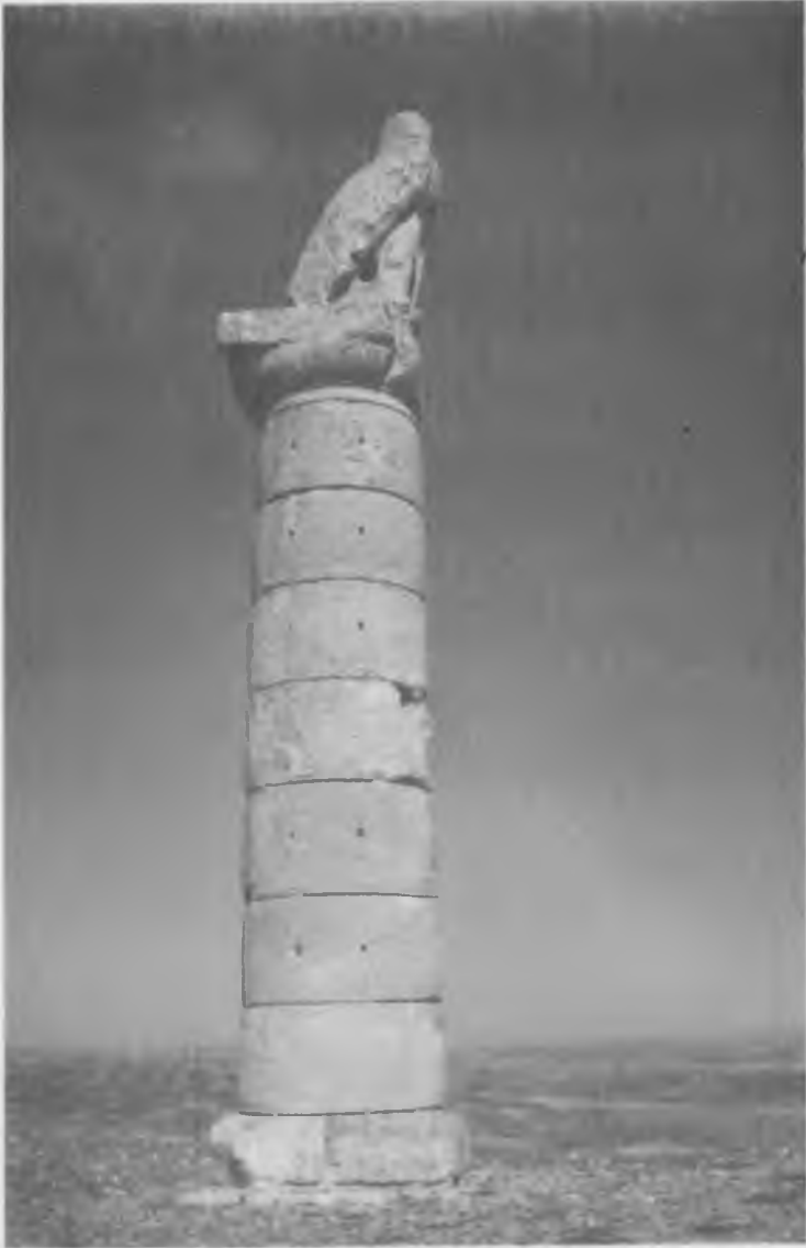
Güneydoğu Anadolu'da Kommagene bölgesindeki bir tümülüs üzerindeki Karakuş.