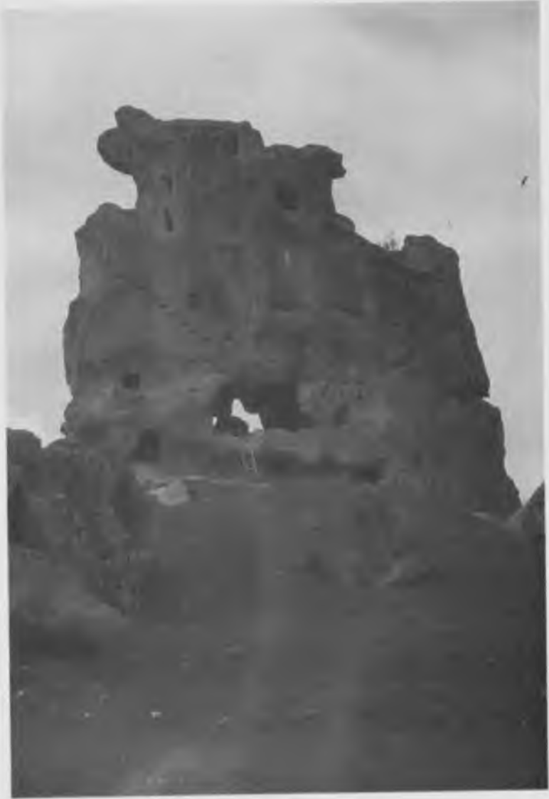
Eskişehir yakınlarında, Doğanlı Kale denen kaya. Zaman zaman, Anadolu'da insan eliyle yapılmış böylesi kayaların, destanların oluşmasına katkısı olmuştur.