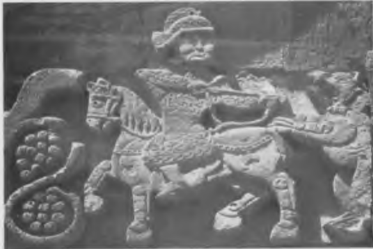
915-921 yıllarına tarihlenen Aktamar Kilisesi'nden bir friz: Asyalı bir step süvarisi yayıyla yaban kedisine ok atmaktadır.