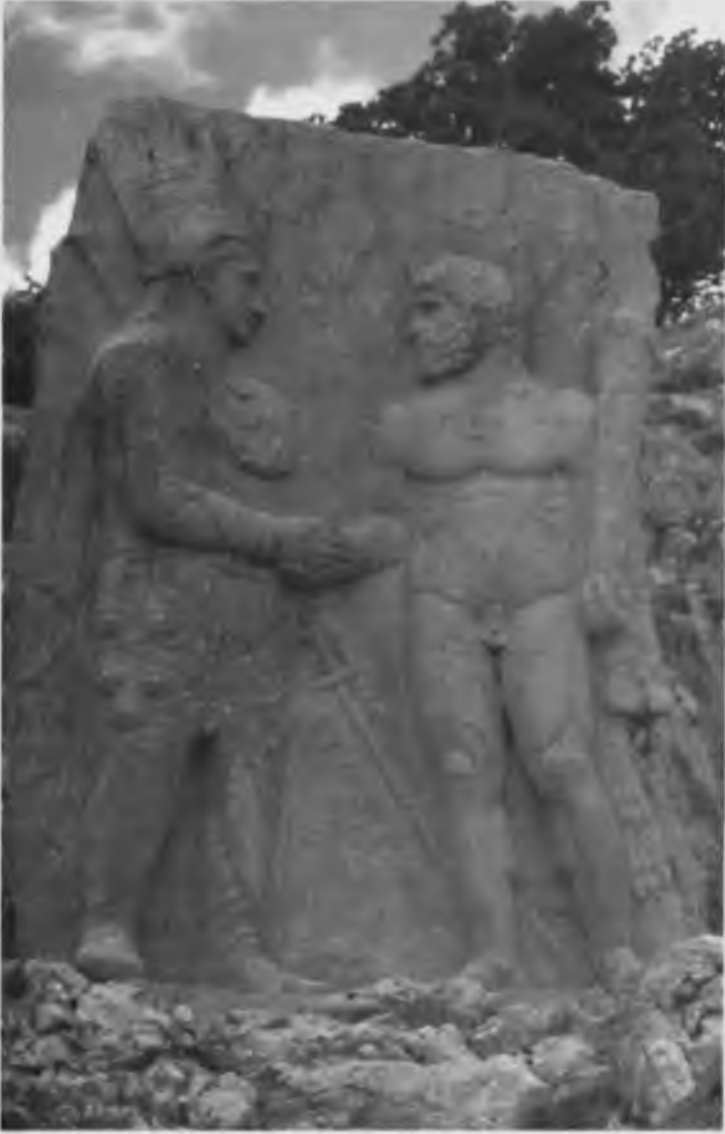
Eski Kâhta yakınlarında (Malatya'nın 60 km güneydoğusunda bulunan Nymphaios civarındaki Arsameia) bir taş kabartmada kral I. Antiochos ve Herakles. Geç Helenistik karışımına (senkretizm) bir örnek.