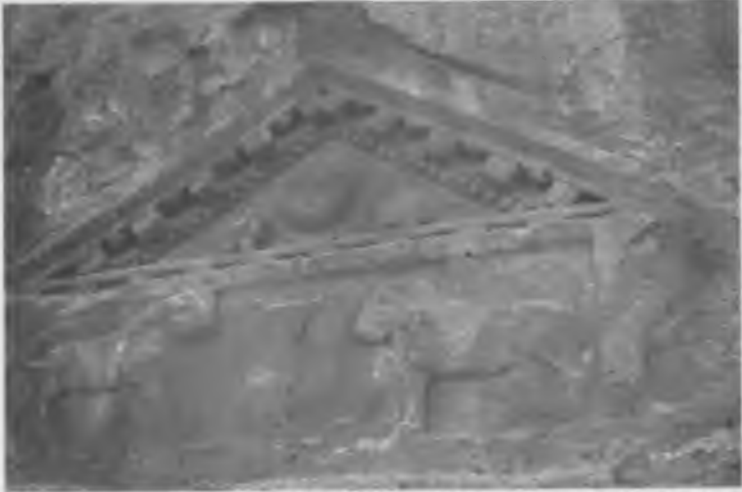
Frig kaya mezarı, Türkçede Alkanlı Mabet (Aslan Tapınağı) olarak bilinir.