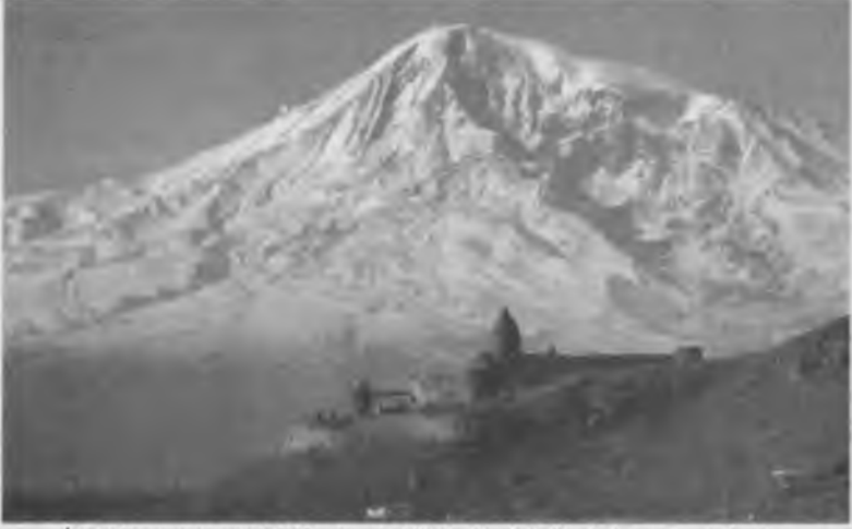
İran ve Ermenistan sınırında 5137 metre yüksekliğinde Ağrı Dağı. Birçok efsane, onun eteklerinde Nuh'un Gemisi'nin karaya oturduğunu anlatır.