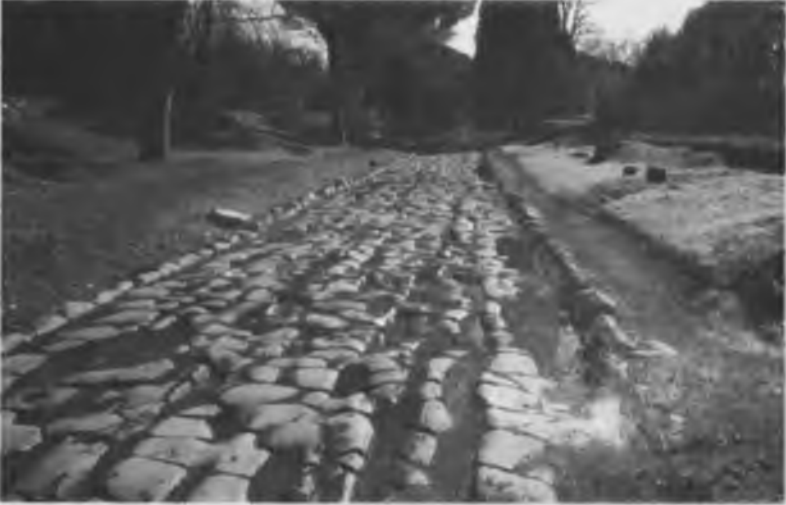
Ege'de Milas yakınlarındaki Euromos'ta (Ayaklı) bulunan Roma caddesi.