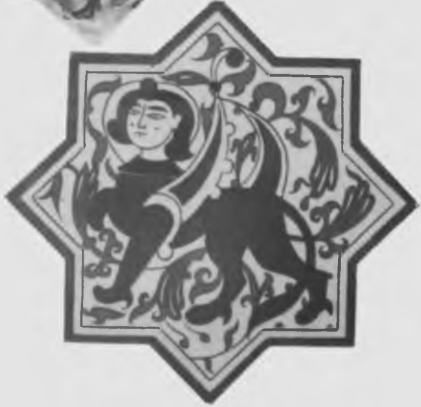
Beyşehir Gölü civarındaki yıkılan Kubadabad şehriden iki Selçuklu çinisi (13. yüzyılın birinci yarısı). Çinilerde taç giymiş insanı andıran kanatlanmış bir fabl yaratığı ile Türkmen yüzü bir kadın tasvir edilmektedir.