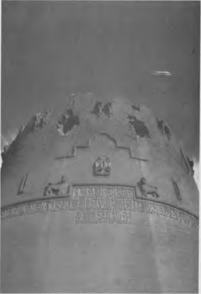
Diyarbakır şehir surlarının 74 kulesinden birinde yer alan çift aslanlı ve çift kartallı Arapça kitabe (13. yüzyıl).