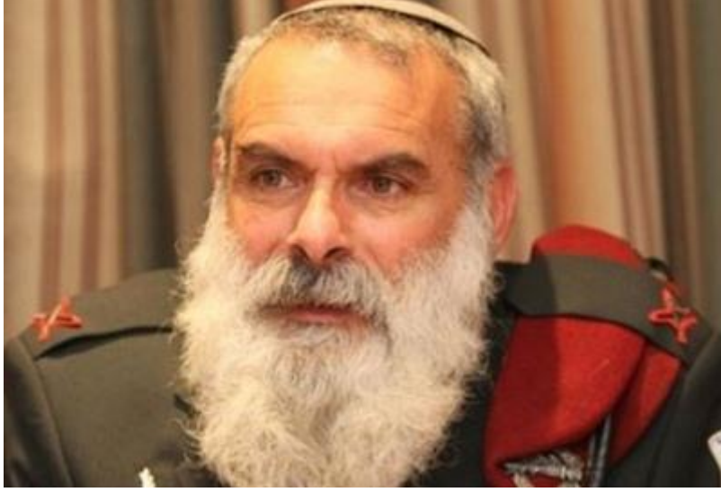
General Haham Avi Ronzki

çıktı. Gazze katliamı sırasında askerlere ‘Sivilleri öldürmek sevaptır’ emri veren ordu hahamı General Avi Ronzki ve geçtiğimiz günlerde yayınladığı bir kitapta ‘Bebekleri katletmek vaciptir’ fetvası veren haham İzak Şapiro’dan sonra bir başka haham da ‘Filistinlilerin mallarını çalmanın helal olduğu’ fetvasını verdi.