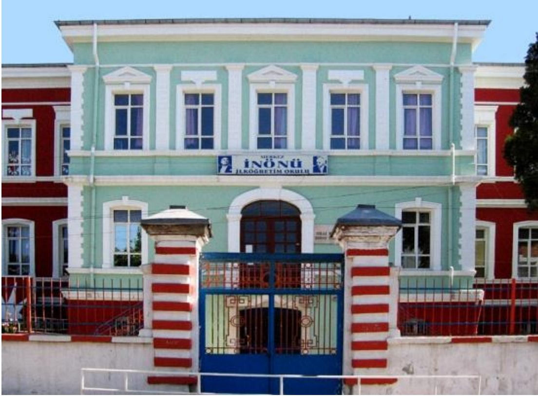
Edirne Alliance Israelite Universelle (Evrensel Musevi Birliđi Okulu) Kaleiçi semtinde bu gün İnönü İlköğretim Okulu olarak kullanılmakta.