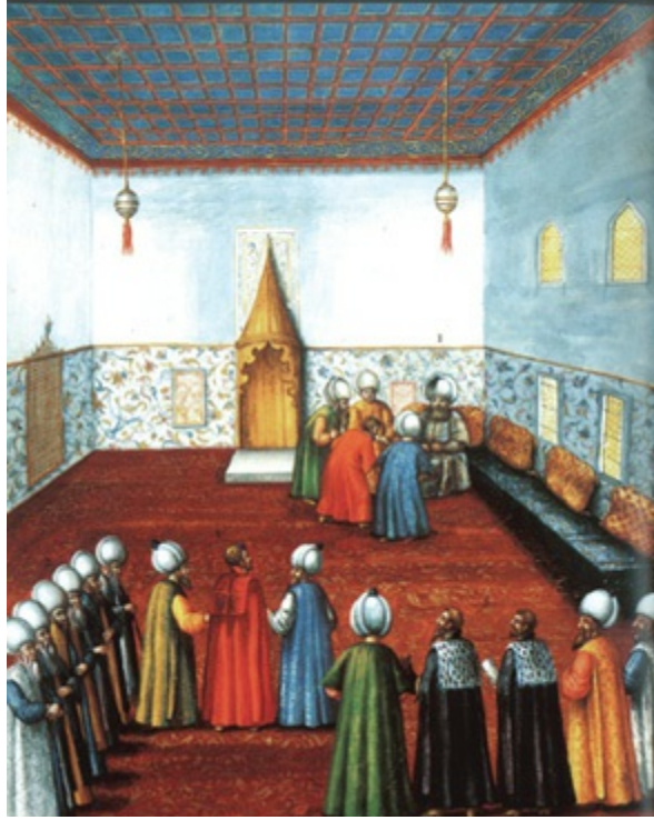
III. Murad'ın 'Arz Odası'nda elçi kabulü (CVI)