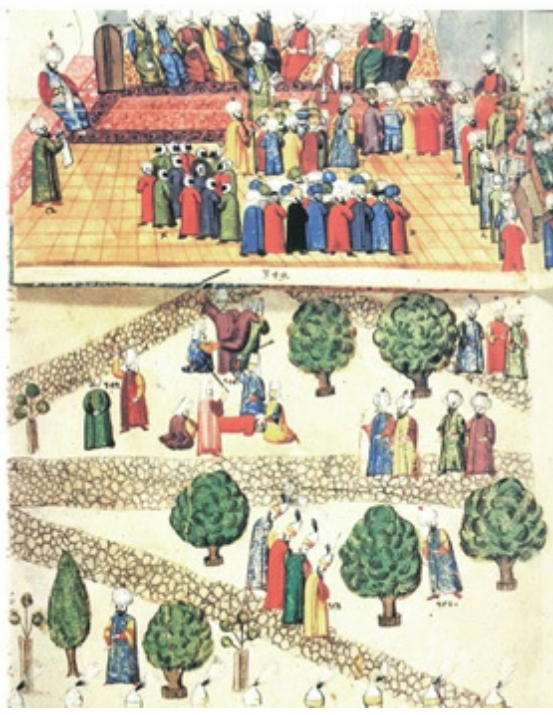
Dîvân-i Hümayûn'da kubbealtı vezirlerinin toplantısı ve saray avlusunda bir ceza infazı (CVII)