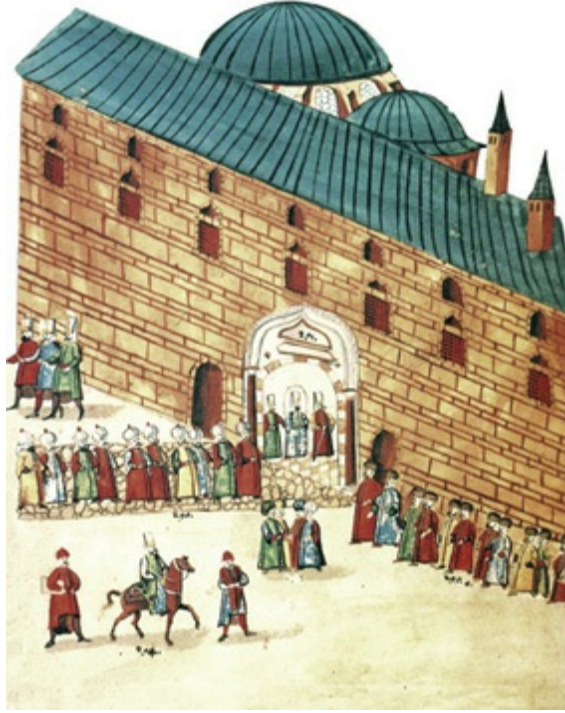
Bâb-i Hümâyûn önünde bir karşılama merasimi (CVII)