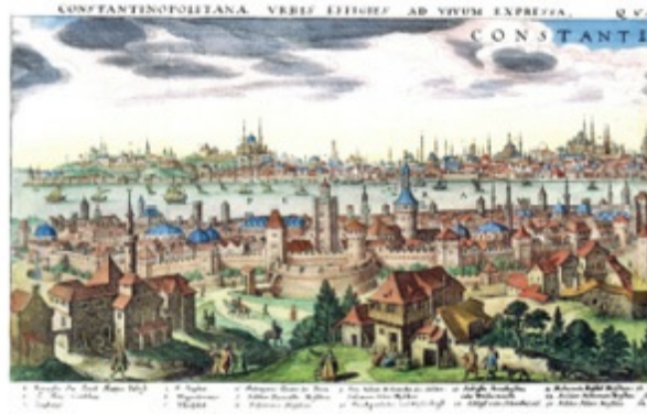
Alman yayıncı Mattheus Merian'ın 1641'de bastığı İstanbul panoraması