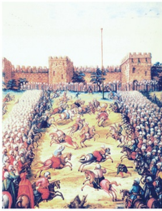
Cüdi Meydanı'nda cirit oyunları (CVI)