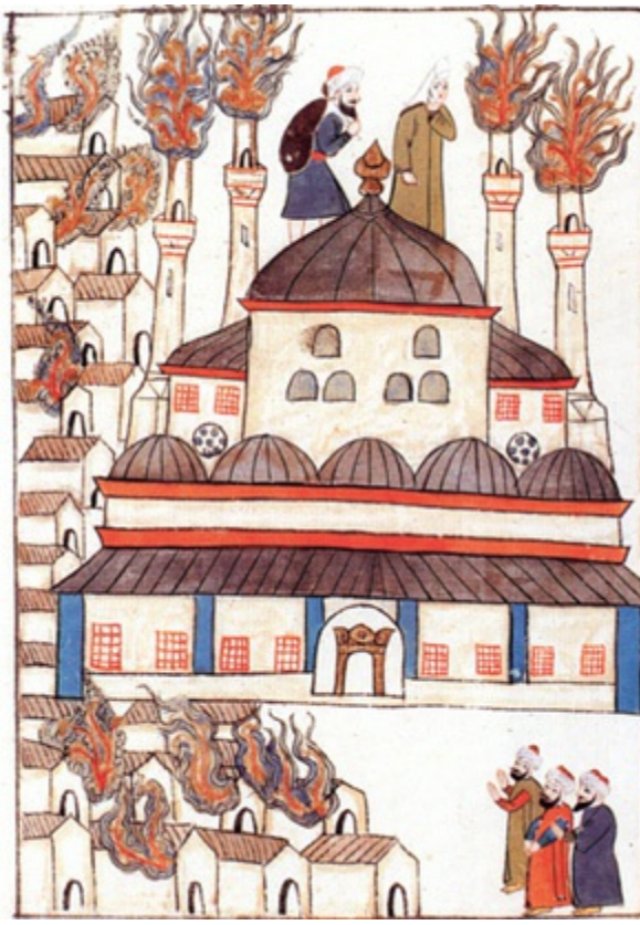
1660'taki Büyük İstanbul Yangını (MC)