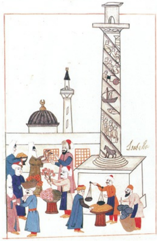
Adını, müşterilerinin ve bir kısım satıcıların kadın olmasından alan Avratpazarı (MC)