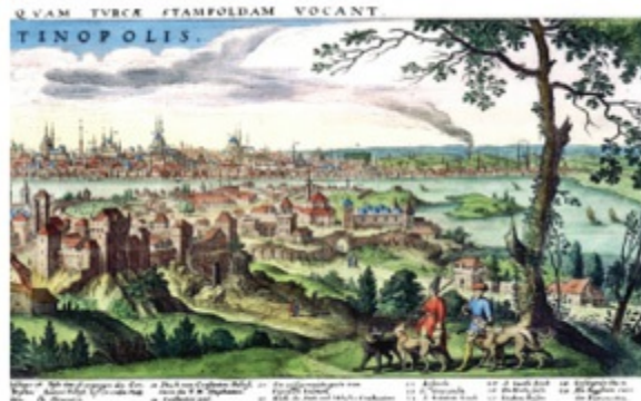
Alman yayıncı Mattheus Merian'ın 1641'de bastığı İstanbul panoraması