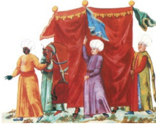
Bir gelin alayında ata binmiş gelinin sayvan altında geçişi (CVII), üstte Bir gelin alayında nahıl taşıyanlar (CVII), altta