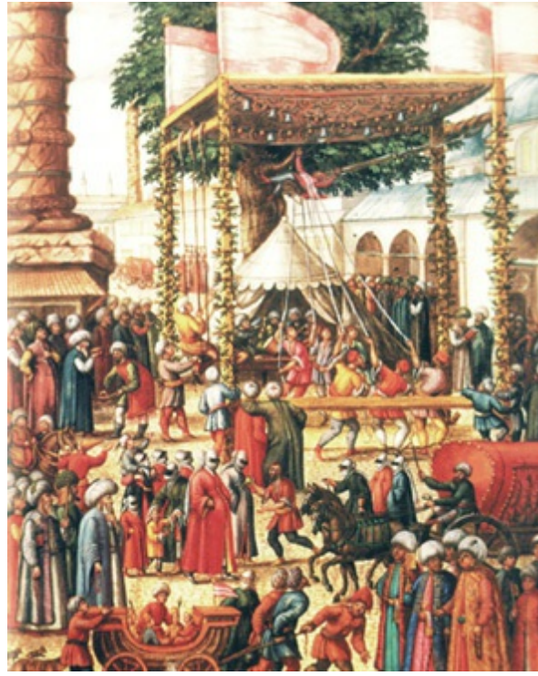
Çemberlitaş'ın yanında, Tavukpazarı'nda kurulmuş bir bayram yerinde halk eğlenceleri (CVI)