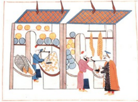
Kavun, karpuz, üzüm vs satan iki yemişçi dükkânı (MC), üstte

Eksik tartı kullanan bir esnafın başında işkembe ve önüne asılı çanla halk içinde gezdirilerek cezalandırılışı (CVI), altta